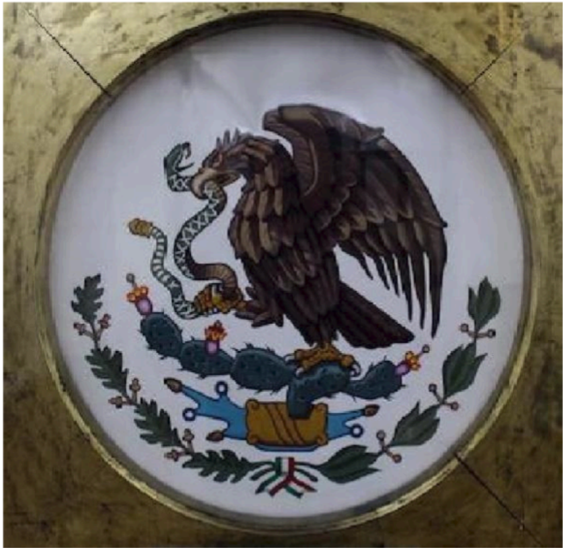
MODELO DE ESCUDO NACIONAL PARA BANDERA