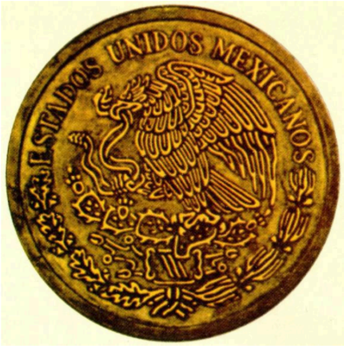
MODELO DE ESCUDO NACIONAL PARA MONEDAS Y MEDALLAS